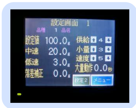
液晶タッチパネル(MITSUBISHI)